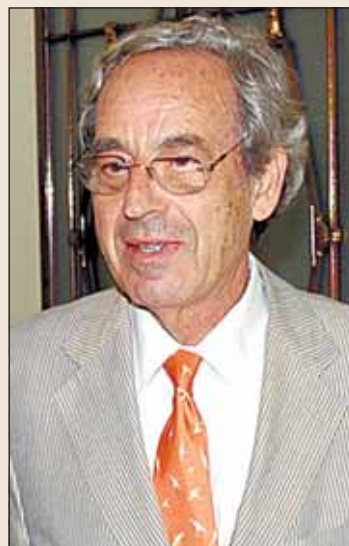
El sociólogo, Salvador Giner

El nacimiento de la UdL es, según el sociólogo, un acto de justicia. "Era totalmente necesario que en el interior del territorio se creara una universidad de referencia, ya que se llegó a crear una línea costera que acogía todos los centros universitarios dejando de lado el interior", apuntó Giner. Uno de los aspectos que destacó el ya Honoris Causa es la capacidad que ha tenido la UdL a la hora de aprovechar los puntos fuertes de Lleida. "La universidad ha conseguido