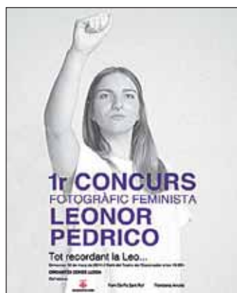
Cartel del concurso fotográfico